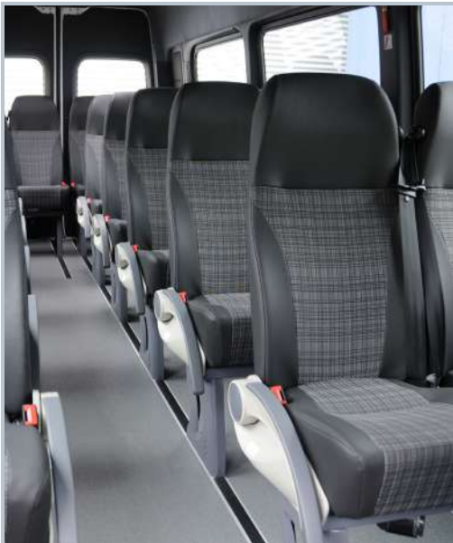
Komfortable und ergonomisch geformte M2 Einzelsitze.

Mercedes-Benz Sprinter - M2 Bus (13 - 19 Sitzler)