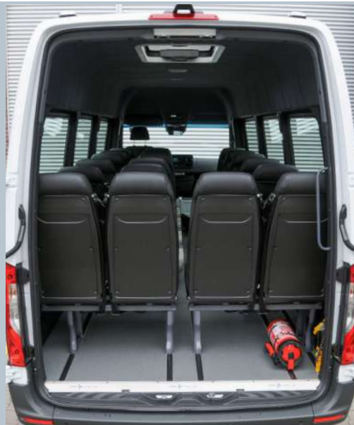
Der AMF-Bruns Smartliner bietet einen großzügigen Innenraum.