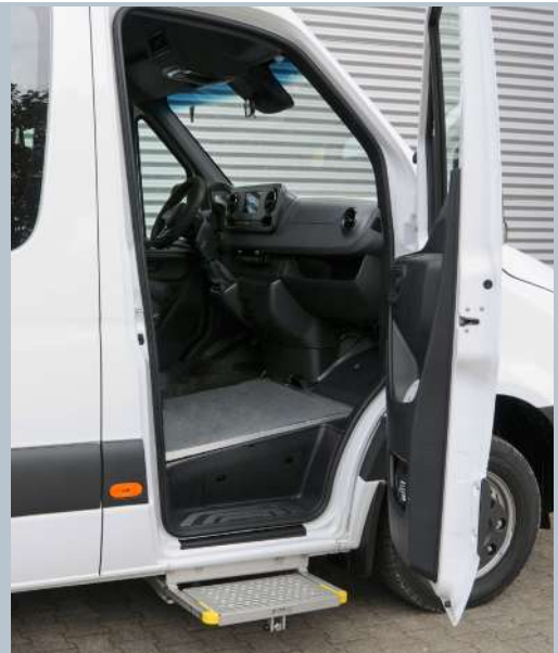
Vollautomatische AMF-Bruns Trittstufe im Einstiegsbereich.