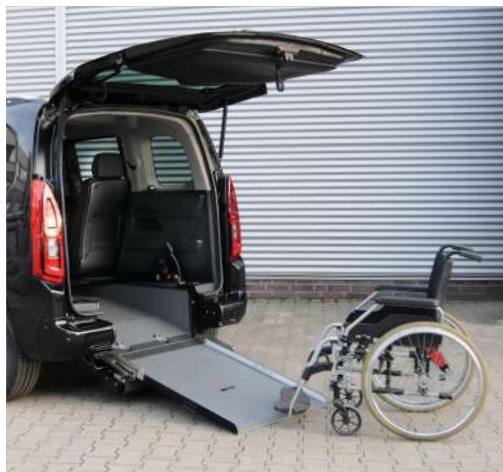
Bei ausgeklappter Rampe kann das Fahrzeug bequem mit dem Rollstuhl befahren werden.