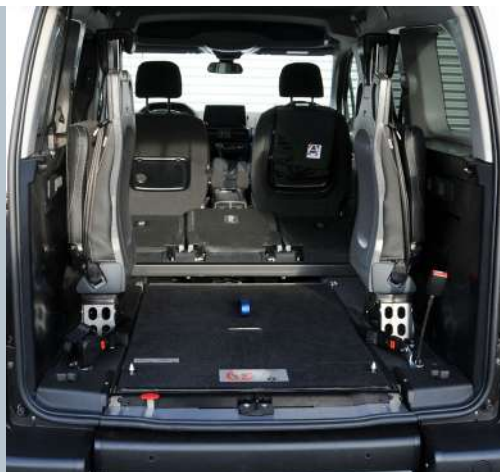
Mit der eingeklappten EASYFLEX Rampe kann der Kofferraum voll genutzt werden.