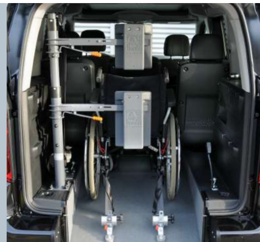
Das Fahrzeug kann mit der Kopf- und Rückenstütze FUTURESAFE ausgestattet werden.